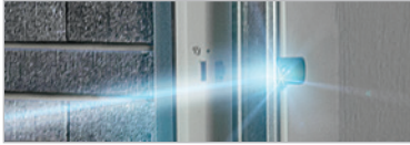
LICHTSCHRANKE FÜR GARAGENTORE