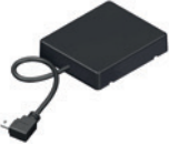
NOVOFERM HOMEMATIC IP MODUL